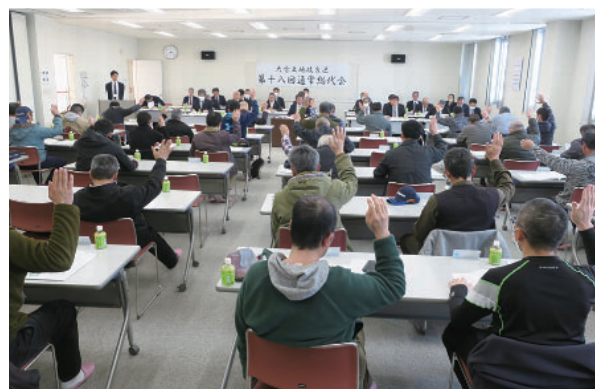
賛成の挙手をする総代