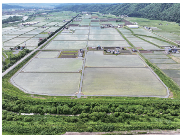
愛別地区国営緊急農地再編整備事業で整備された水田(愛別町豊里地区)