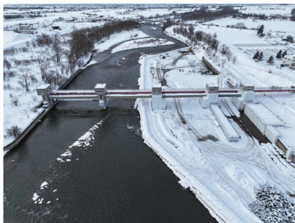
共栄近文二期地区国営かんがい排水事業で工事が進められている「近文頭首工」(令和5年12月撮影)